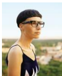
Matali Crasset Présidente du Jury

Matali Crasset est designer industriel de formation. Son travail, qui s'est imposé à partir des années 90 comme le refus de la forme pure, se conçoit comme une recherche en mouvement, faite d'hypothèses plus que de principes.